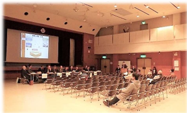
住民説明会の様子(京田辺市立中央公民館)

本組合と枚方市・京田辺市は、平成30年2月8日(木)と11日(日)に京田辺市立中央公民館で、2月9